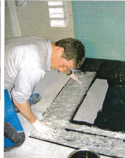
Danach beim Uebergang auf den Unterlagsboden. Die Breite ist frei wählbar bis zur Abdichtung des ganzen Vorraumes.