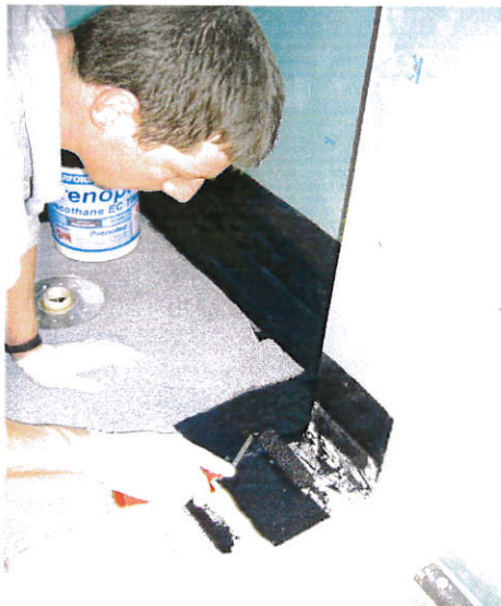
Die Fugenbänder werden vollständig mit dem hochflexiblen, dauerelastischen Prenopur Flüssigkunststoff eingebettet.