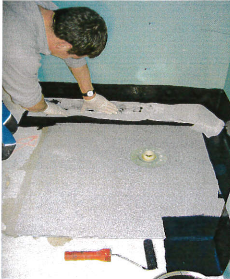
In noch feuchte Schicht Prenopur, Fugenband Prenotec Reemat einlegen und satt einbetten. 1. Bei Aufbordungen.