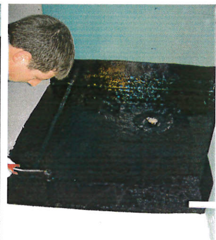
Bis sämtliche Fugenbänder im Prnopur FLK verschwinden und die Oberfläche porenfrei glänzt.