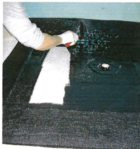
Anschliessend wird die ganze Preno Aquasafe-Duschtasse mit Prenopur überzogen.