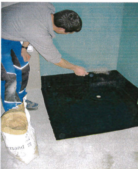
Die noch feuchte Schicht Prenopur gleichmässig von Hand abquarzen.