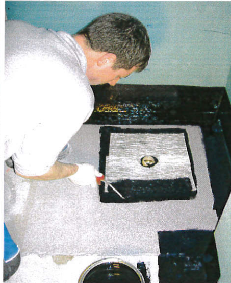
Anschliessend beim Ablauf.