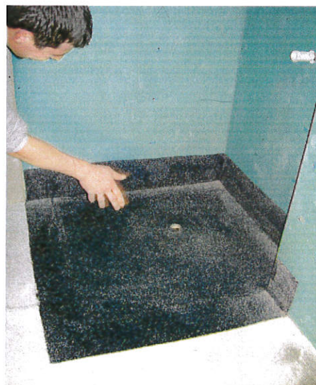
Zuerst die Aufbordungen, danach die Bodenfläche.